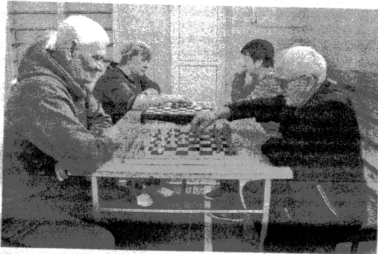
Участники шахматного турнира.