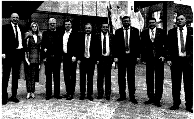
Представители округа с участниками "Золота полей".

Прозвучали тёплые слова и в адрес ветеранов аграрной отрасли, тех, кто принимал активное участие в становлении сельского хозяйства Ставрополья.